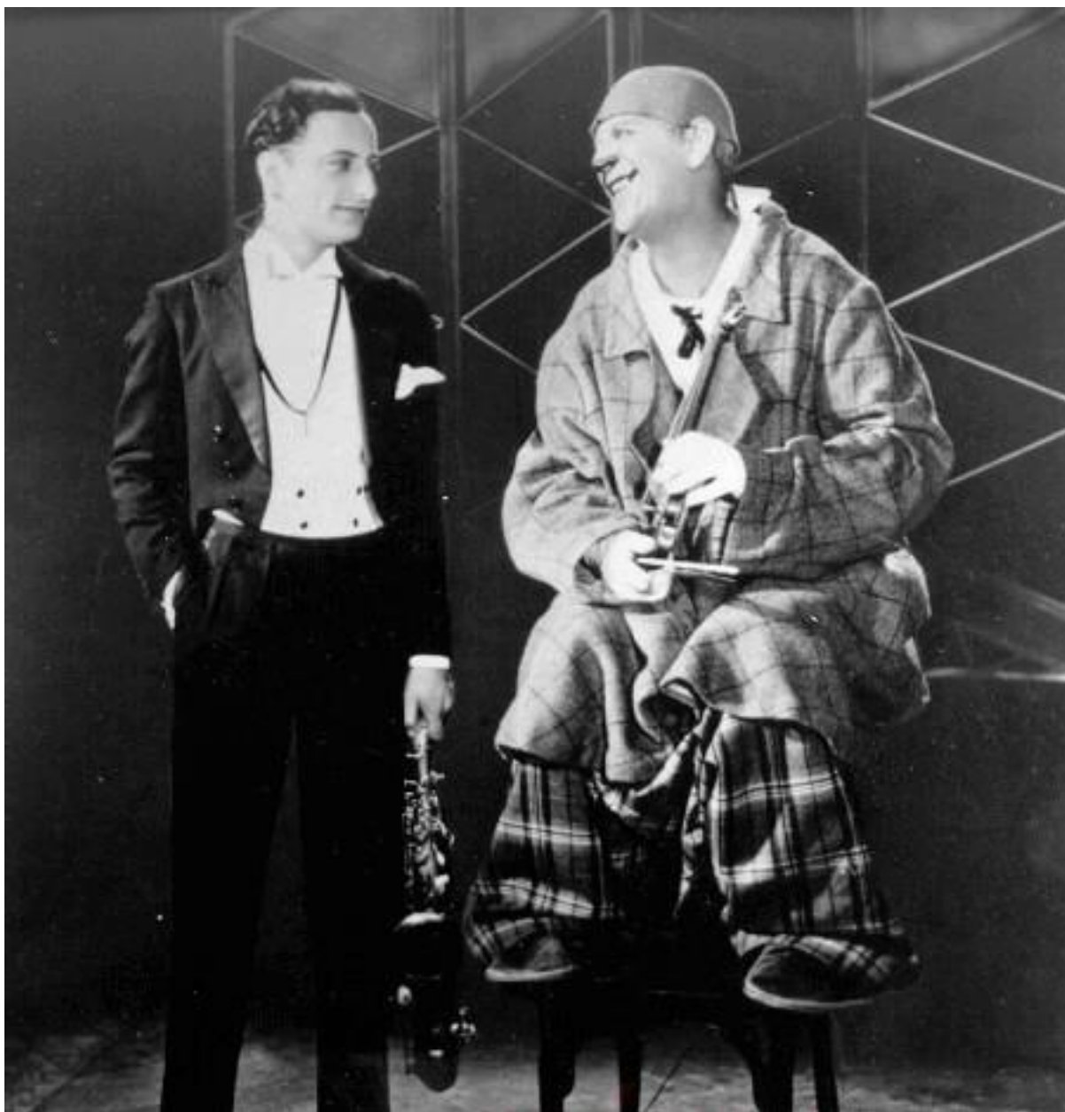
1930, Grock avec Max van Emden, photographie, Association Grockland.

En ligne : https://www.grockland.ch/images/portraits/Grock_3.jpg