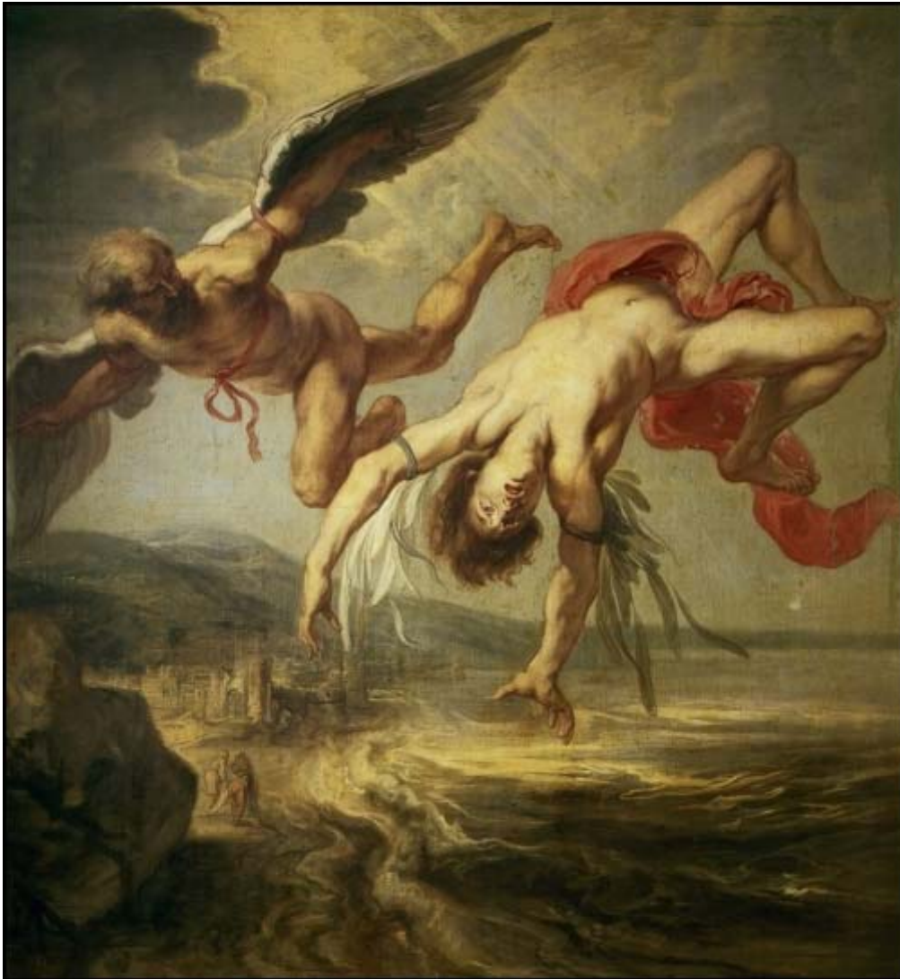
La Chute d'Icare, Jacob Peter Gowi d'après Rubens, 1636, Musées Royaux des Beaux-Arts, Bruxelles.