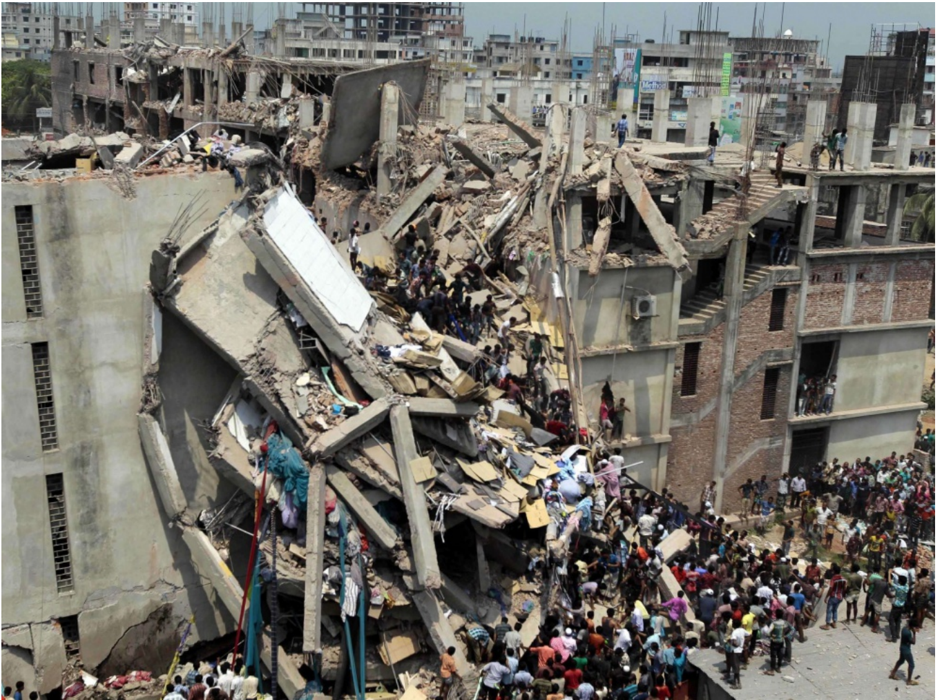
Photographie de l'effondrement du Rana Plaza le 24 avril 2013 situé en banlieue de Dacca, capitale du Bangladesh, A.M. Ahad/AP/SIPA.

Note : Mille cent trente-deux travailleurs y ont perdu la vie. Il s'agit du plus grave accident de l'histoire de l'industrie du vêtement.