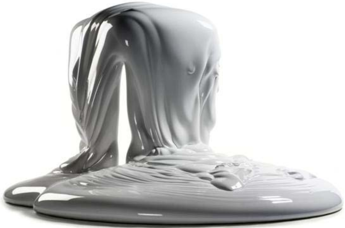
Expansion n°37 , César, 1972, polyester armé de fibre de verre et laqué, 105 x 90 x 115 cm, succession César, Adagp, Paris, 2008