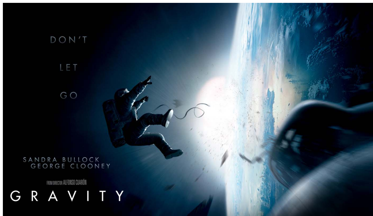
Affiche du film Gravity , Alfonso Cuarón, 2013.