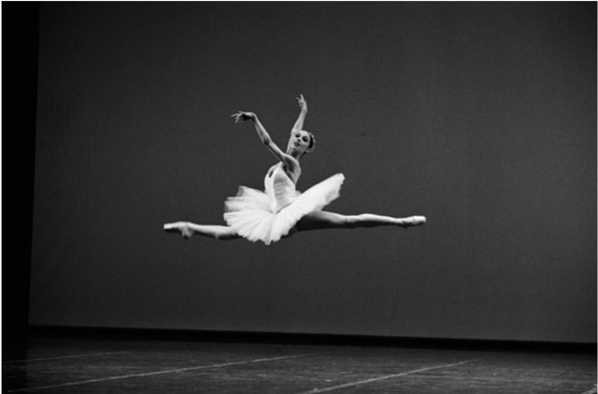
Danseuse de ballet – grand jeté, illustrant le Gala d'étoiles, saison 5.