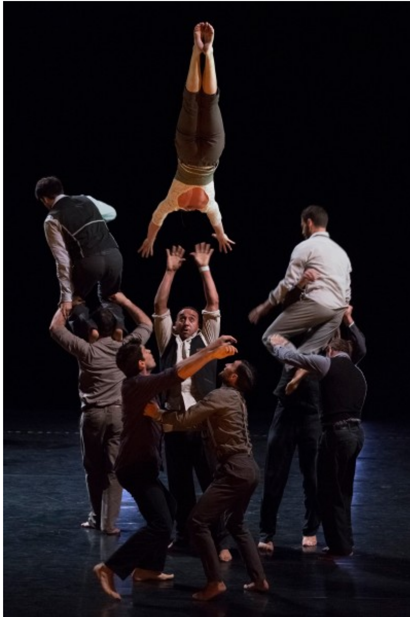
Cie XY, Il n'est pas encore minuit , 2014, photographie extraite du site de la compagnie.