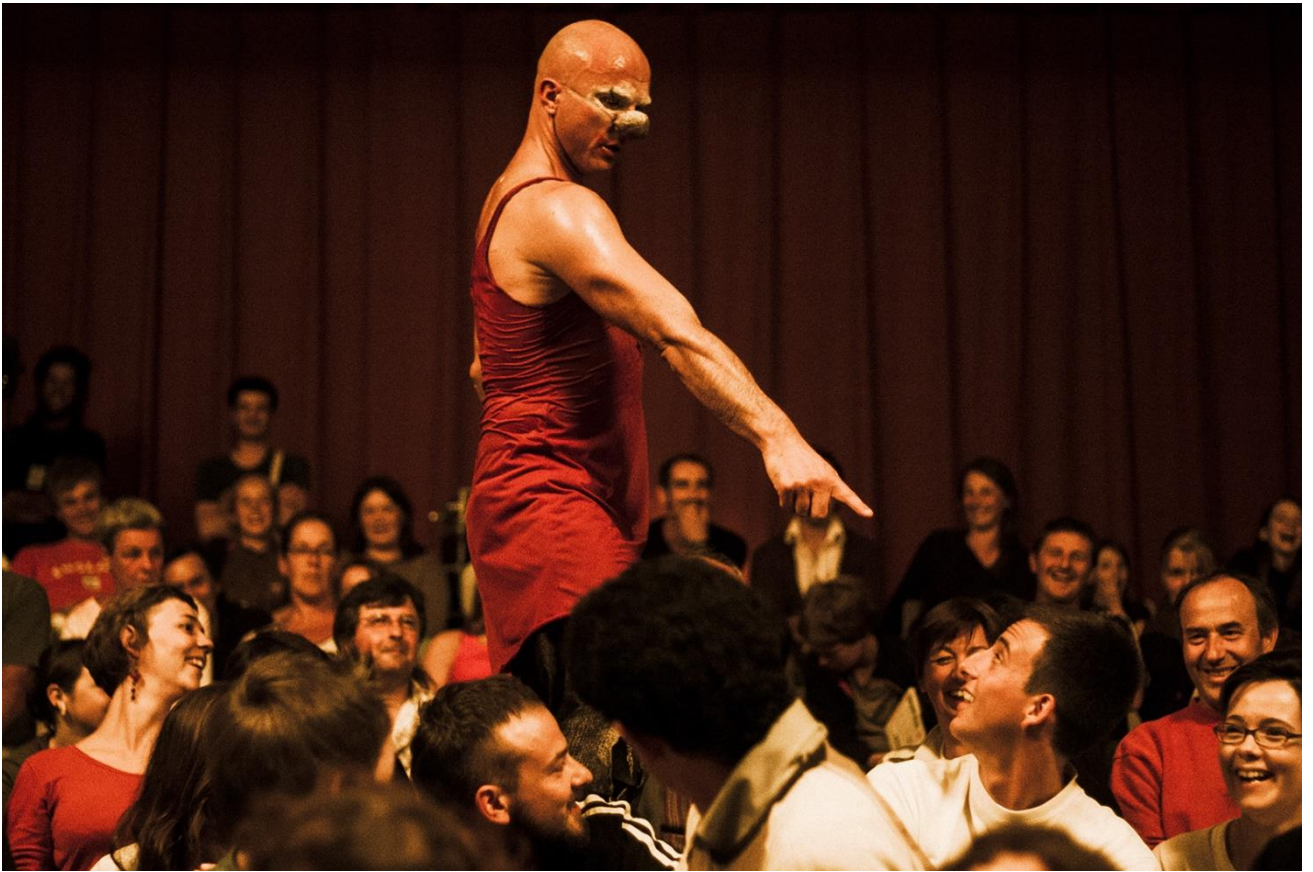
Ludor Citrik (Cédric Paga), Je ne suis pas un numéro , 2006, Philippe Laurençon, 2006, Encyclopédie des arts du cirque , BnF CNAC, BnF éditions multimédias, 2021.