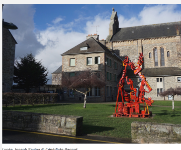
Lycée Joseph Savina