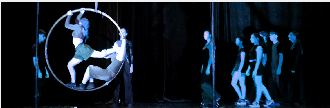
Création scolaire présentée au festival UNSS