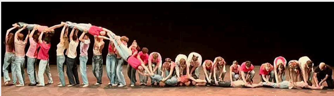
Création scolaire présentée au festival UNSS