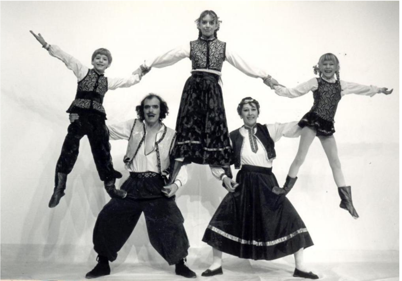
PHOTO: LA FAMILLE RASPOSO 1987. Spectacle de rue. “Une vraie famille de saltimbanques”.